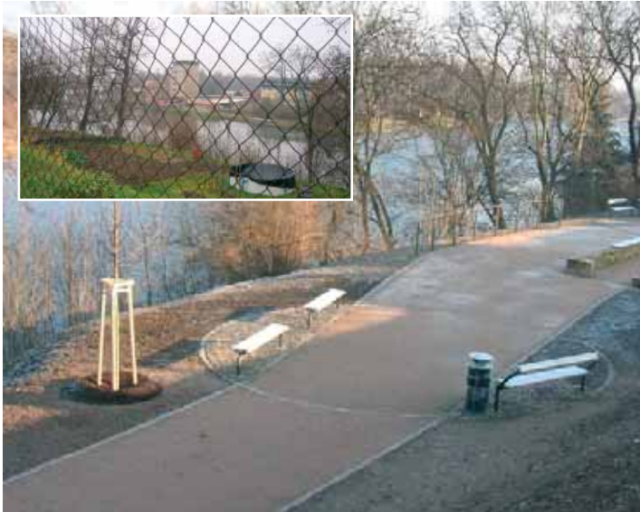
Vyhlídková terasa po rekonstrukci.

Uplynulý rok probíhal na brandýském pracovišti odboru životního prostředí docela svižným tempem - kromě běžné agendy jsme měli na starosti tři nové projekty ve fázi realizace a dva ve fázi projektové přípravy.