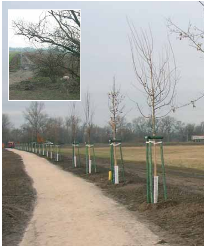
Polní cesta po rekonstrukci. Alej prvňáčků - Proboštské stromořadí

Je vydlážděné pro naše město typickou dlažbou z křemencových odseků a oplocené rovněž bytelným zábradlím. U Labe vyrostla opěrná zeď ze šedé žuly, která koresponduje s kamenným