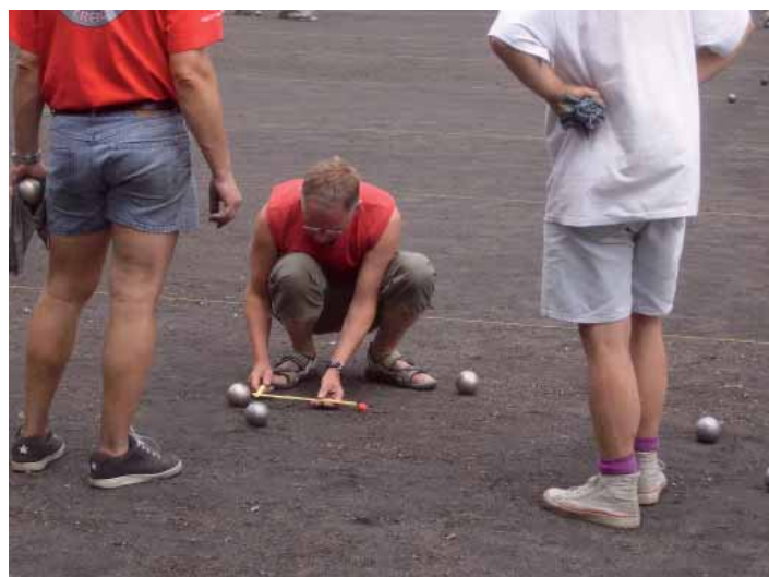
O vítězi někdy rozhodují milimetry.

Začínající hráč namaluje na zem malý kroužek - metu, odkud se