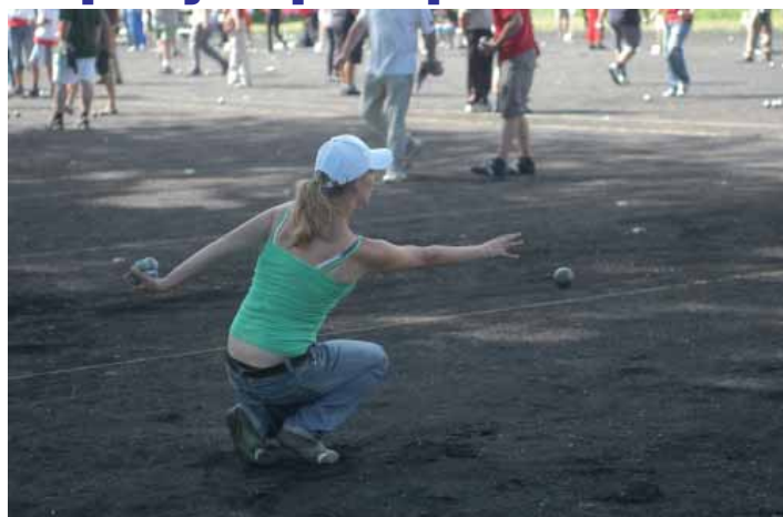
Hází se ocelovými koulemi o váze 700 až 800 gramů.

pak v průběhu celé hry hází. V následujících hrách se meta umísťuje na místě, kde skončilo prasátko v minulé hře. Dále hráč hodí prasátko libovolným směrem 6-10 m daleko (ženy a děti mohou 6-8 m). Poté hodí kouli tak, aby skončila co nejlíže prasátku. Dál se družstva v házení střídají - každé hází tak dlouho, dokud některá z jeho koulí není prasátku nejlíže. Koule se nesbírají a hází se pořád z toho samého místa. Když jednomu z družstev koule dojdou, to druhé dohází ty své. To družstvo, které má nakonec kouli nejlíže, vyhrálo, a získává tolik bodů, kolik má koulí blíže než je nejlíže soupeřova. Při tom se může všechno - např. odpalovat koule soupeře, odpalovat prasátko, postrkávat svoje koule atd.