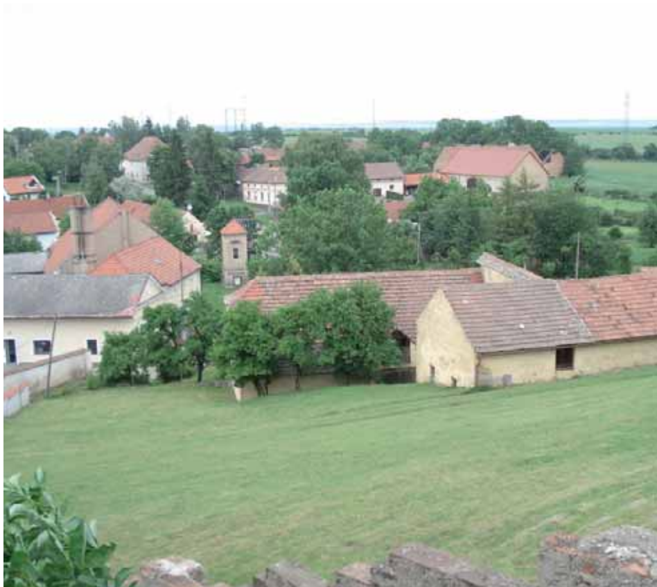
Poznáte i tuto část města? Malebné Popovice!

Na ochranu půdy máme v České republice zákon o ochraně zemědělského půdního fondu. Podle jeho zásad by se mělo postupovat i při tvorbě územních plánů všech stupňů. Pro nezemědělské účely se podle tohoto zákona má použít především nezemědělská půda, zejména nezastavěná